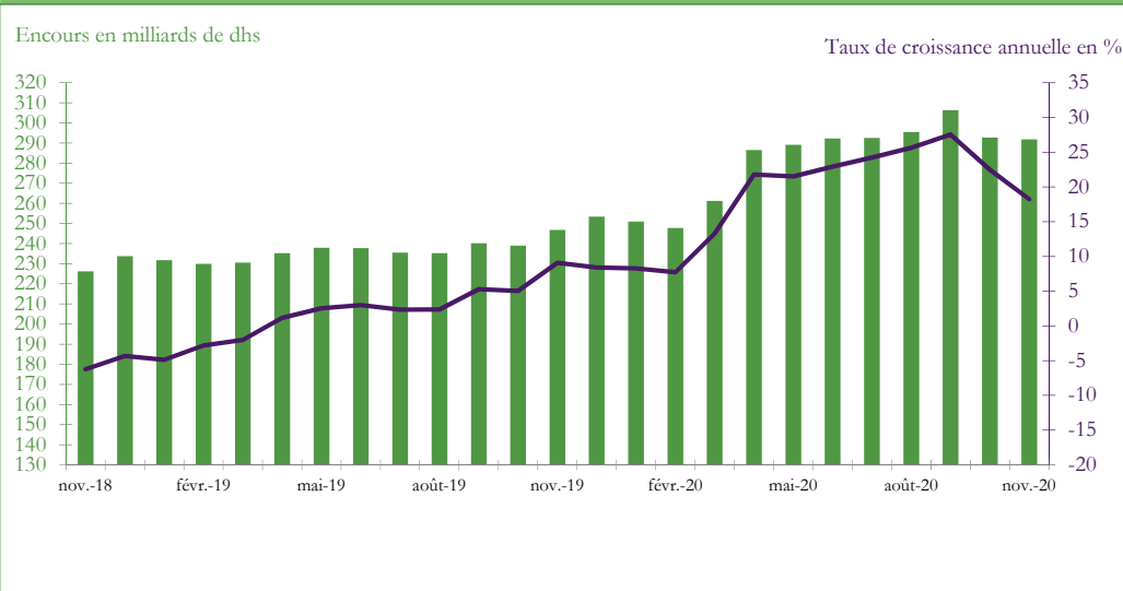
Graphique 3 : EVOLUTION DES AVOIRS OFFICIELS DE RESERVE